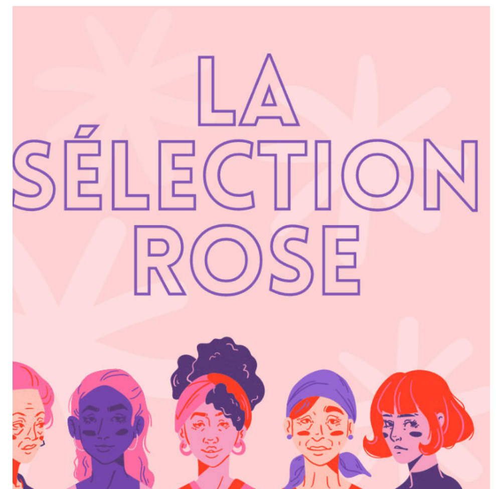
La sélection rose Octobre rose: Ensemble, luttons contre le cancer du sein.