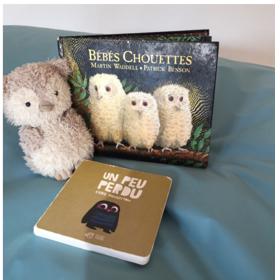
Eveil aux langues. Bébés lecteurs Mercredi 7 et 14 octobre. 10h30 - 11h Gratuit. Inscriptions à la Mella'thèque ou par mail: bibliotheque@mellac.bzh