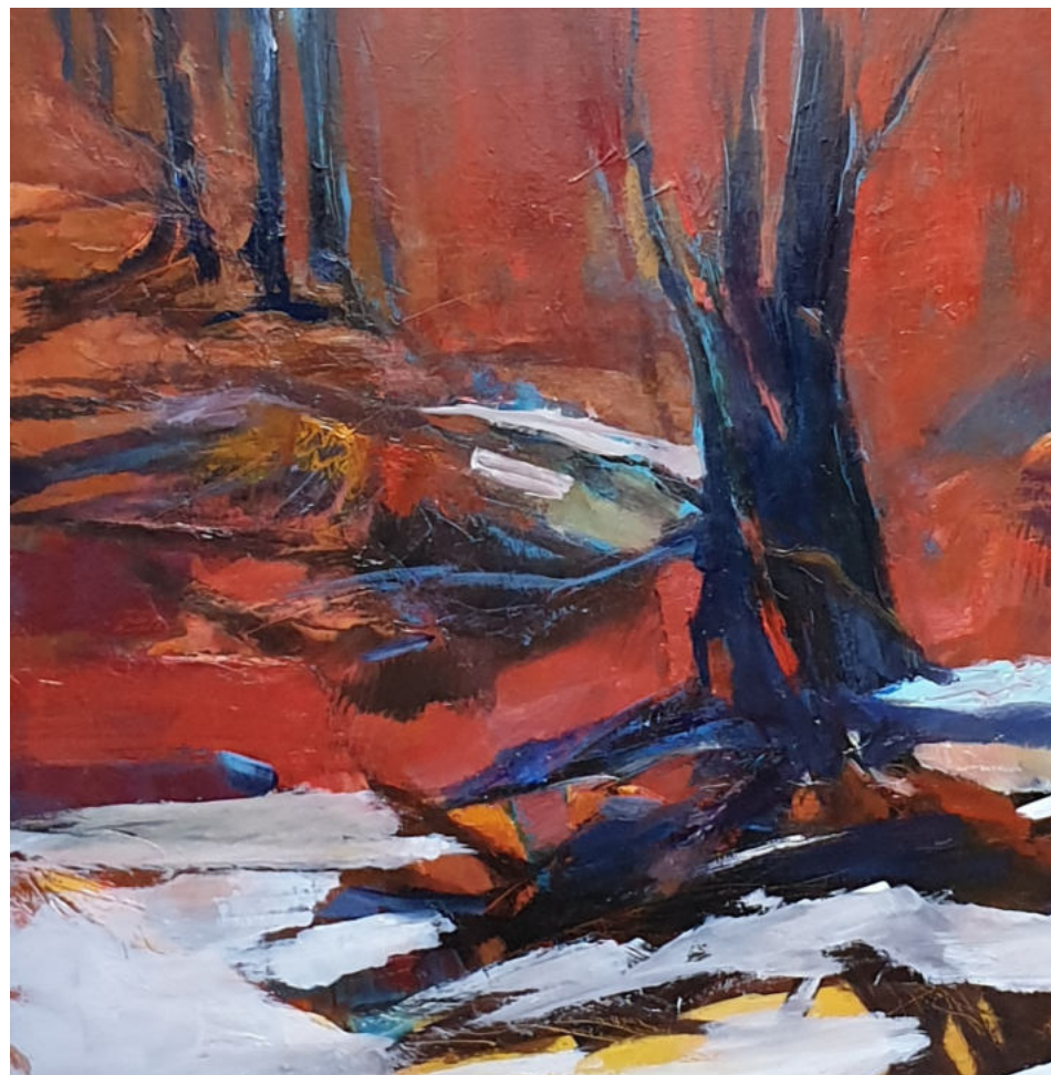
Exposition Sylviane Bardou Passion Africaine 14 octobre - 15 décembre Entrée libre