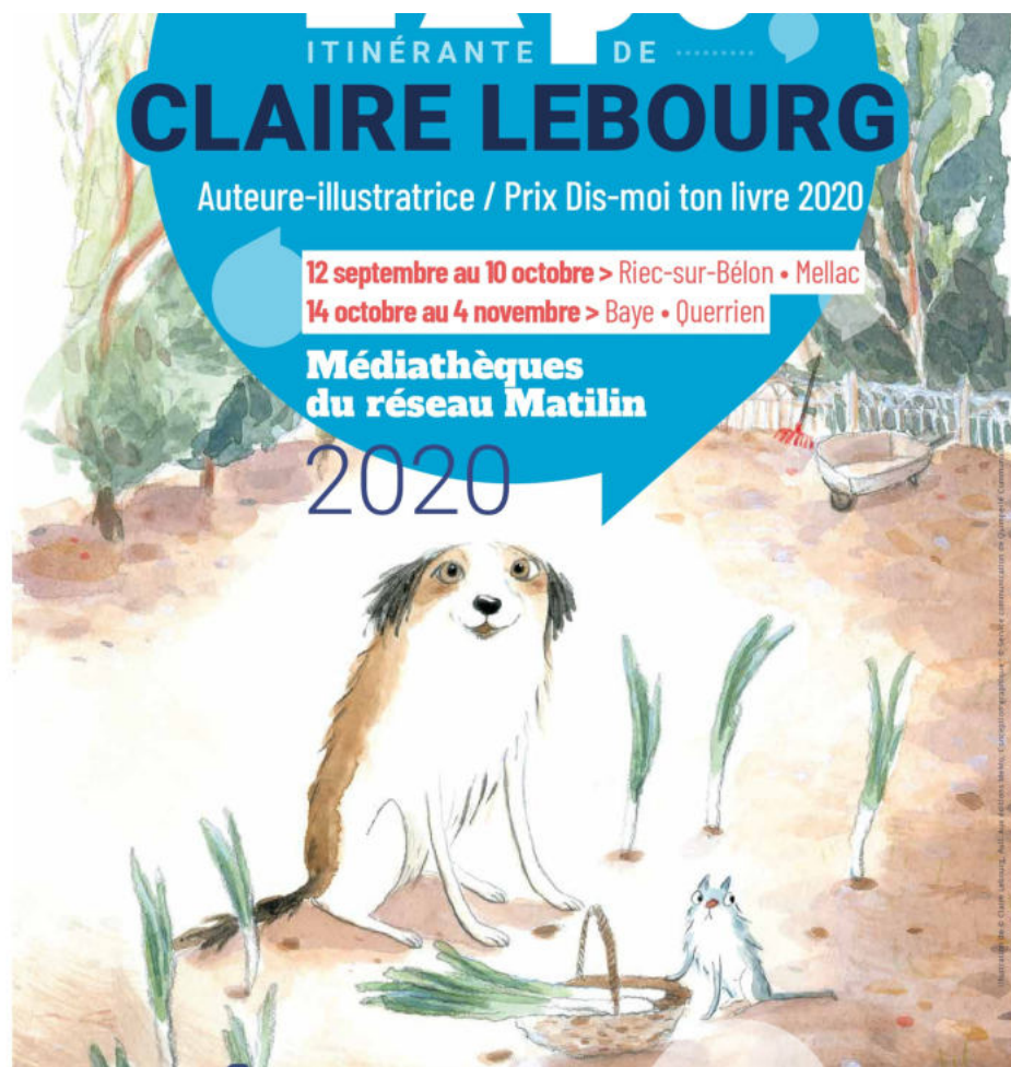
Exposition Claire Lebourg Auteure-illustratrice jeunesse 12 septembre - 10 octobre Entrée libre